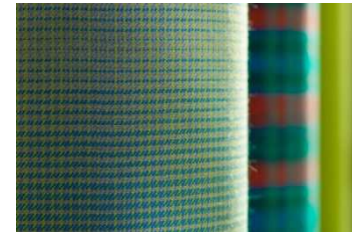
ウール/ビスコース/ポリアミド