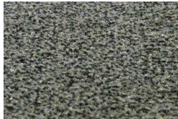
ウール/ポリアミド